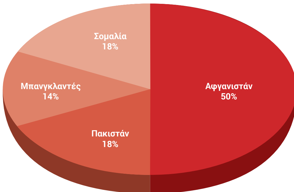
Πίνακας 2 Κατανομή νεαρών συμμετεχόντων ανά χώρα προέλευσης

Τηρήθηκαν όλα τα απαραίτητα μέτρα υγιεινής σύμφωνα με τις εθνικές κατευθυντήριες οδηγίες (χρήση προστατευτικών масκών προσώπου, διατήρηση των απαραίτητων αποστάσεων ασφαλείας, διατήρηση των παραθύρων ανοιχτών και χρήση απολυμαντικού τζελ χεριών). Όλες αυτές οι συνεδρίες πραγματοποιήθηκαν πρόσωπο με πρόσωπο, στα διαμερίσματα SIL και SILA.