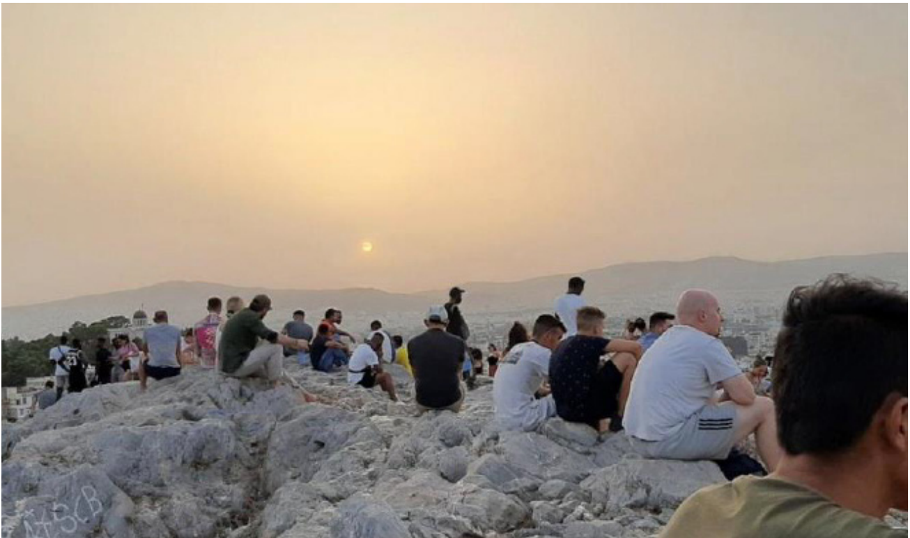
Τίτλος: “Άνθρωποι από διαφορετικές κοινωνίες”

“Σεβασμός” είναι η λέξη κλειδί σε αυτή τη φωτογραφία, που τραβήχτηκε ένα βράδυ από ένα σημείο με θέα την Ακρόπολη. Ο νεαρός που τράβηξε τη φωτογραφία είπε: «Η σύγχρονη κοινωνία μας απεικονίζεται σε αυτή την εικόνα